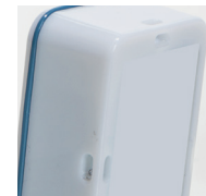
Outils de fixation au dos de l'appareil