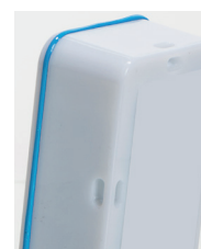
Oeillets de fixation au dos de l'appareil